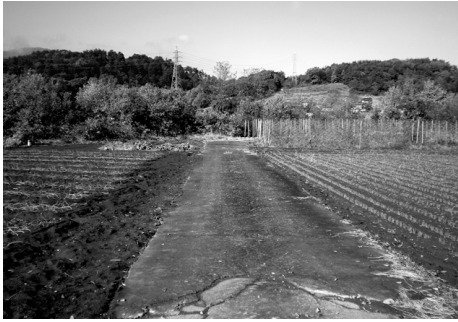
佐久往還道標と新府古道

や鍛冶屋などが繁盛し、物資の調達拠点として発展しました。ちなみに、富士川舟運では、年貢米以外の下り荷として煙草、生糸、木炭などがあり、上り荷としては塩が主で、その他、魚、畳表、油粕、干鰯、瀬戸物、砂糖などでした。